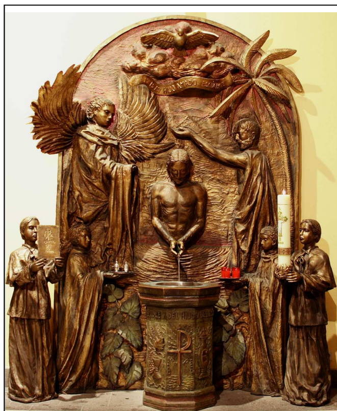
Fuente Bautismal de esta Parroquia de San Agustín inaugurada en 2006

Conocéis lo que sucedió en el país de los judíos, cuando Juan predicaba el bautismo, aunque la cosa empezó en Galilea. Me refiero a Jesús de Nazaret, ungido por Dios con la fuerza del Espíritu Santo, que pasó haciendo el bien y curando a los oprimidos por el diablo, porque Dios estaba con él.»