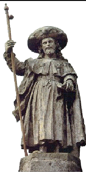
Santiago Apóstol, Patrón de España, ruego por nosotros

Fue un gran defensor de la vida y de la familia. Fue canonizado por Juan Pablo II en 1983.