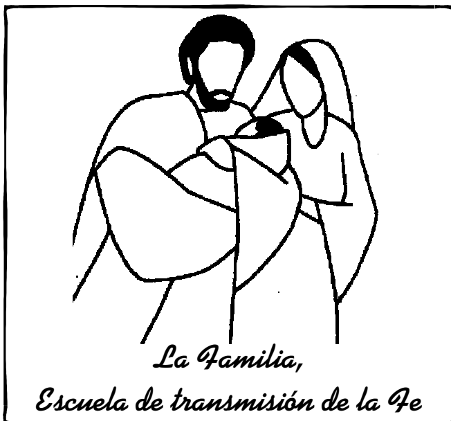
La Familia, Escuela de transmisión de la Fe

Dios hace al padre más respetable que a los hijos y afirma la autoridad de la madre sobre su prole. El que honra a su padre expía sus pecados, el que respeta a su madre acumula tesoros; el que honra a su padre se alegrará de sus hijos y, cuando rece, será escuchado; el que respeta a su padre tendrá larga vida, al que honra a su madre el Señor lo escucha. Hijo mío, sé constante en honrar a tu padre, no lo abandones mientras viva; aunque choquee, ten indulgencia, no lo abochornes mientras viva. La limosna del padre no se olvidará, será tenida en cuenta para pagar tus pecados.