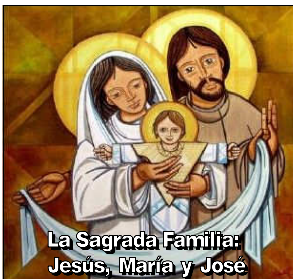
La Sagrada Familia: Jesús, María y José