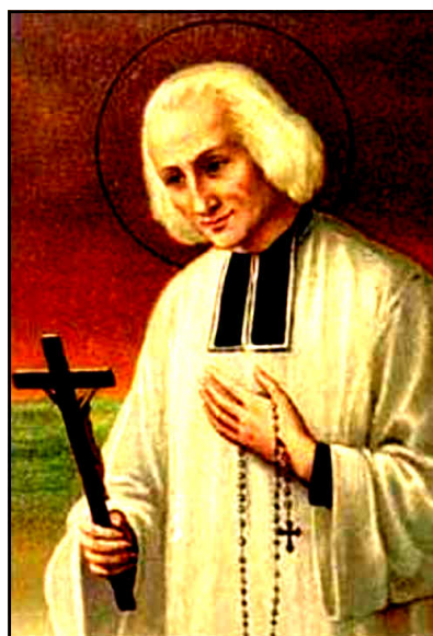
San Juan Bautista Vianney, Cura de Ars, patrono de los párrocos

En 1681 fue arrestado y condenado a muerte por traidor y por difundir el catolicismo. Fue canonizado en 1975