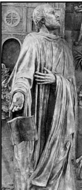
Imagen de San Agustín en el Retablo del Altar Mayor de la Iglesia de San Agustín, obra de Luis Arencibia Betancort.