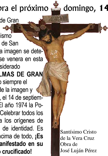
Santísimo Cristo de la Vera Cruz Obra de José Luján Pérez

El Ayuntamiento de esta Ciudad de Las Palmas de Gran Canaria mandó construir el año 1524 una ermita dedicada al Santo Cristo de la Vera Cruz en el mismo lugar donde más tarde se edificó la actual Iglesia de San Agustín, y donó la primera imagen. Cuando esta imagen se deterioró, le encargó a Luján Pérez la actual, que se venera en esta iglesia desde el año 1813. Siempre se le ha considerado PATRONO DE ESTA CIUDAD DE LAS PALMAS DE GRAN CANARIA y el Excmo. Ayuntamiento ha ejercido siempre el Patronazgo preocupándose de la conservación de la imagen y de los actos de cultos que se celebran en su día, el 14 de septiembre, y el Viernes Santo que sale en procesión. El año 1974 la Policía Local lo adoptó también como su patrono. Celebrar todos los años su fiesta es una exigencia de fidelidad a los orígenes de nuestra Ciudad. Es cuidar de nuestras señas de identidad. Es disfrutar de nuestro patrimonio cultural. Y por encima de todo, ¡Es celebrar el amor que Dios Padre nos ha manifestado en su Hijo Jesucristo que entregó su vida muriendo crucificado!