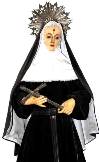
Imagen de Santa Rita que se venera en esta parroquia desde la época de los PP. Agustinos (1664-1835).

Porque siguió fielmente las enseñanzas de Jesús llegó a ser santa. Murió un 22 de mayo hacia la mitad del siglo quince.