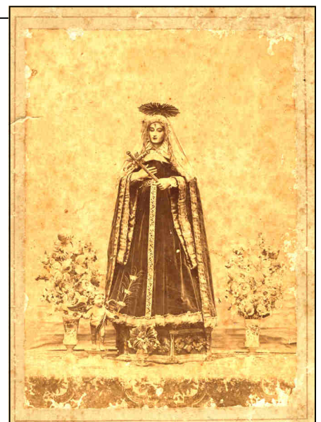
Recuerdo de la imagen de Santa Rita venerada en esta parroquia - año 1890

Más tarde, el 5 de Mayo de 1918, el Obispo D. Justo Marquina erigió canónicamente la Cofradía de santa Rita. La Cofradía desapareció poco después de la guerra civil de 1936. No así la devoción y el culto que se ha visto notablemente incrementado en los últimos decenios habiéndose extendido por numerosas parroquias de la diócesis.